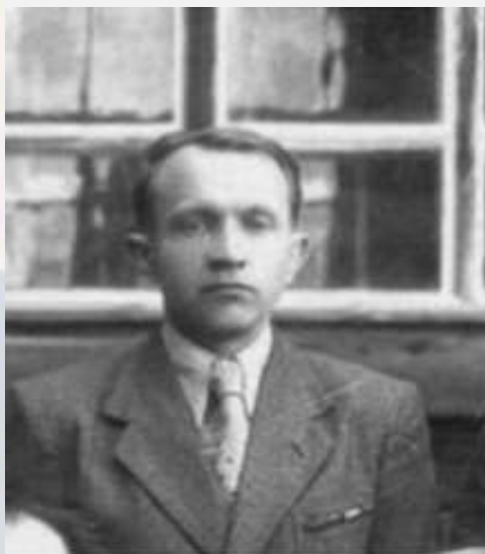
Из наградного листа к медали «За боевые заслуги»

Призван на фронт 22.07.1941 г. Оленинским РВК Калининской области. Старший лейтенант. Воевал на Волховском, Западном и Белорусском фронте. Служил переводчиком отдела контрразведки «Смерш» 63-ей армии. Легко ранен и контужен.