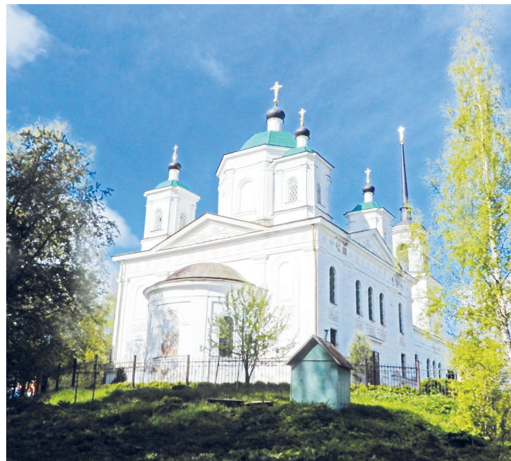
Вознесенский собор в Кашине

В 1910 году рядом с обветшавшей деревянной церковью выстроили новую, из красного кирпича, в неорусском стиле. Деревянный храм разобрали; впоследствии, уже при Совет-