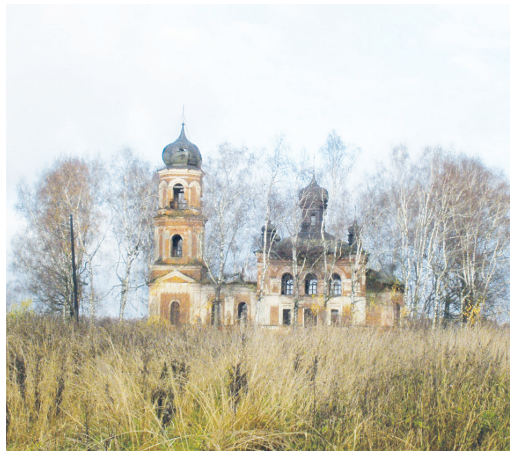
Церковь Вознесения Господня в селе Вознесенье

ской власти, здесь было устроено кладбище.